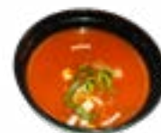
99 TOMATO SOUP TOMATENSOEP TOMATO SOUP