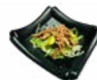
91 BEEF SARADA BEEF BEEF