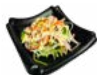
92 KANI SARADA KRAB CRAB