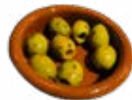
93 OLIVES OLIJVEN OLIVES