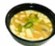
98 MISO SOUP GROENTESOEP VEGETABLE SOUP