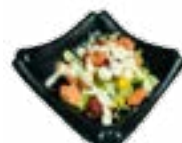
94 SASHIMI SARADA RAUWE VISSALADE FISH SALAD