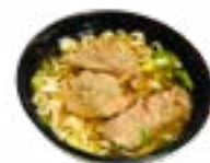
100 UDON GYU RIBEYE BAMISOEP RIBEYE NOODLESOUP