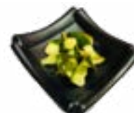
90 TSUKEMONO ZURE KOMKOMMER SOUR CUCUMBER