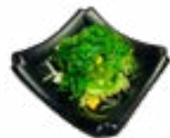
89 CHUKA WAKAME SARADA ZEEWIER SEAWEED