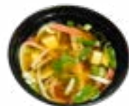
97 CRAB SOUP KRABSOEP CRAB SOUP